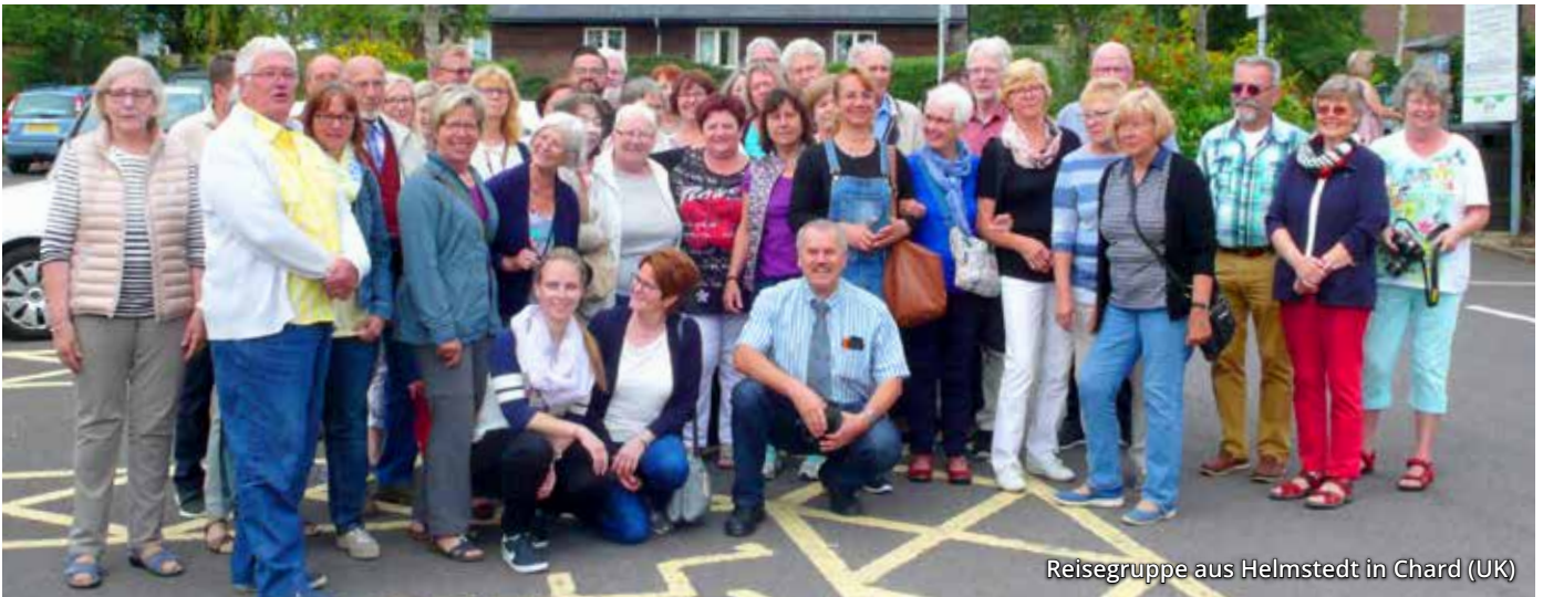
Reisegruppe aus Helmstedt in Chard (UK)