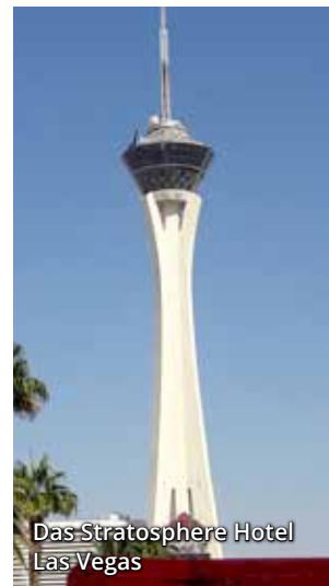
Das Stratosphere Hotel Las Vegas