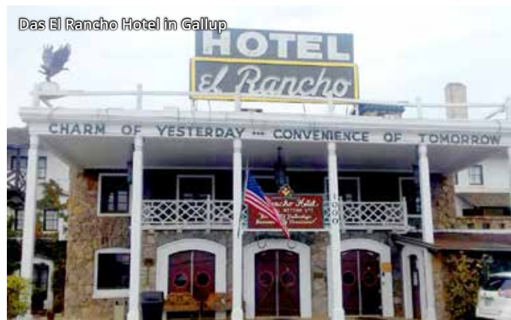
Das El Rancho Hotel in Gallup