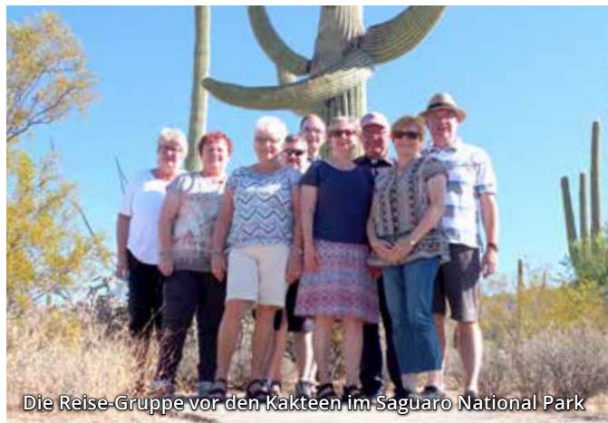
Die Reise-Gruppe vor den Kakteen im Saguaro National Park