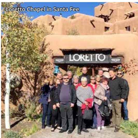
Loretto Chapel in Santa Fee

Ihre Adresse bei Krankheit und in Gesundheitsfragen